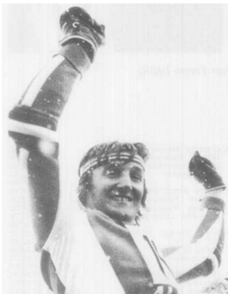
Piero Gros (ITA)