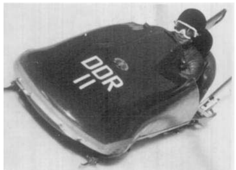
Meinhard Nehmer - Bernard Germeshausen (GDR)