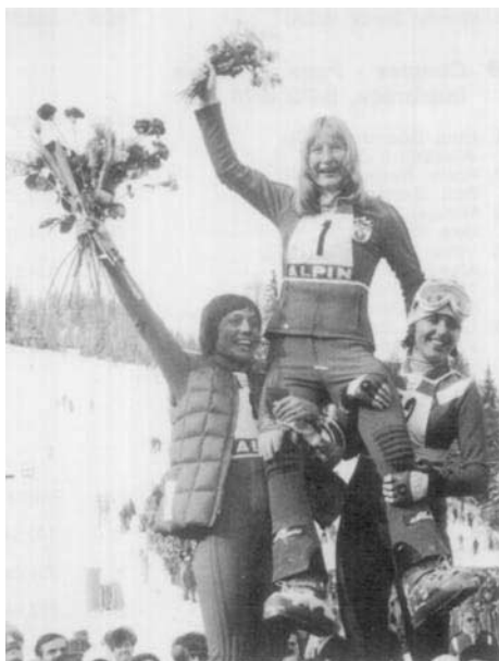
Rosi Mittermaier (RFA), Kathy Kreiner (CAN), Danièle Debernard (FRA)