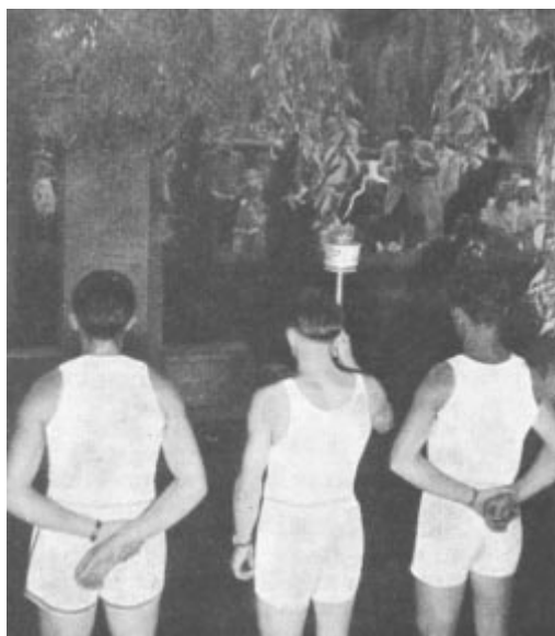
La flamme olympique, de passage à Lausanne, devant la tombe du baron P. de Coubertin, rénovateur des Jeux.