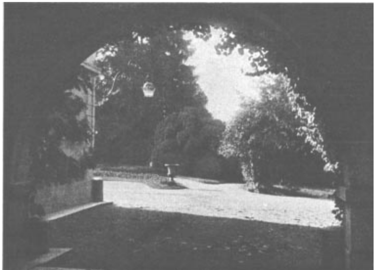
Vue d'un coin du parc de Mon Repos.