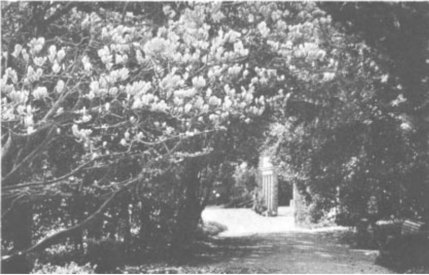
Les magnolias en fleurs au printemps dans le parc de Mon Repos à Lausanne.

tion internationale des sociétés d'aviron a remis en garde au musée. Réd. ) Là encore une inscription bien caractérisée de l'esprit du rénovateur des jeux modernes retient l'attention. En voici les termes : « L'important aux Jeux olympiques n'est pas d'y gagner, mais d'y prendre part, car l'essentiel dans la vie n'est pas tant de conquérir que de bien lutter. » Dans la salle suivante se trouvent toutes les nombreuses décorations et diplômes du baron de Coubertin ainsi que l'acte authentique de la Municipalité de Lausanne conférant au rénovateur des Jeux la bourgeoisie d'honneur de la ville de Lausanne. Dans une autre salle sont réunis les innombrables diplômes, distinctions, coupes, médailles, challenges, objets d'art, manuscrits des compositeurs des hymnes olympiques, statues et bronzes, vases précieux, qui constituaient naguère les récompenses des vainqueurs des jeux. On sait que ces objets — parfois, il faut