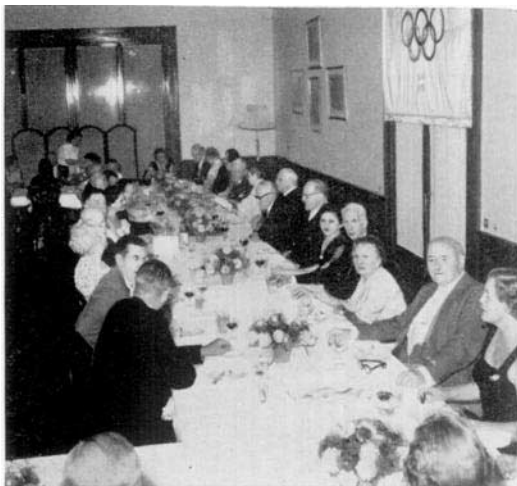
Lausanne. Dinner offered by the City to the members of the I. O. C. and other sports Authorities on the occasion of the Transfer of powers from Mr. J. S. Edström to Mr. A. Brundage.