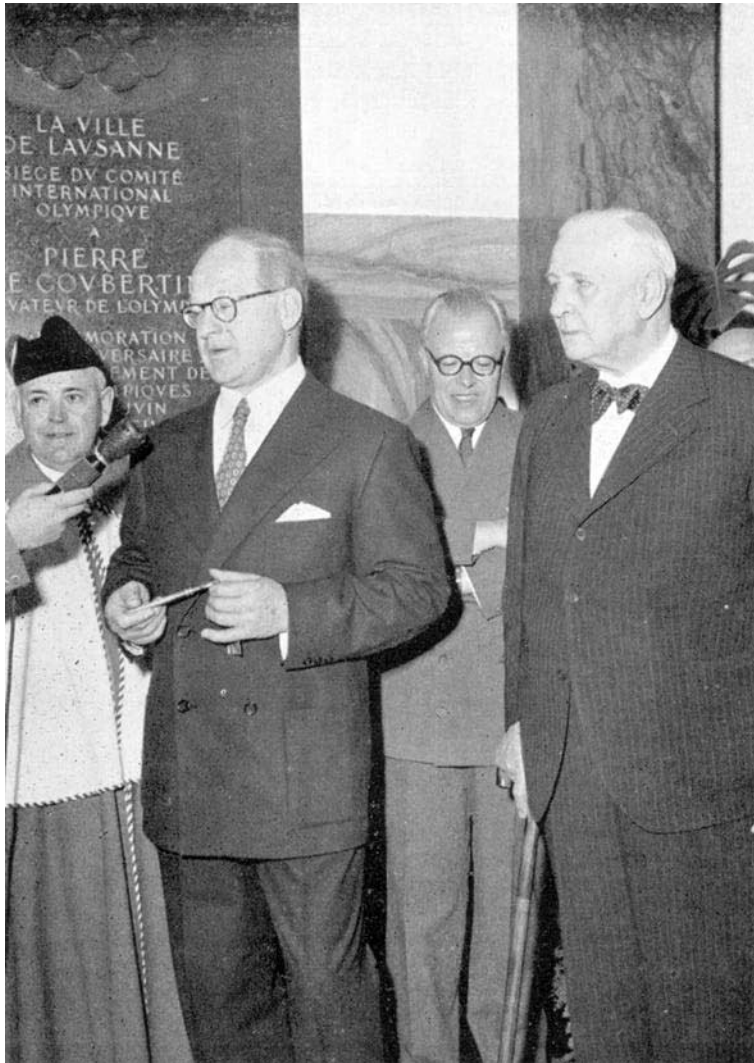
The new President has received the key and makes his speech. Between both Presidents stands Mr. Pierre Graber, member of the Municipality of Lausanne. Le nouveau président a reçu la clé et prononce son discours. Entre les deux présidents: M. Pierre Graber, conseiller municipal à Lausanne.