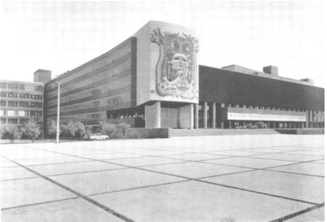
One of the University of Mexico buildings where contestants in the II. Pan-American Games to be held March 12-26 in 1955 will be housed and fed.