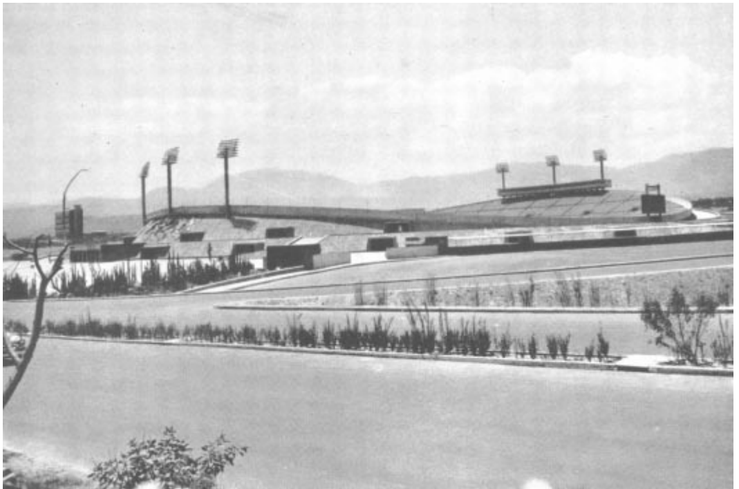
Le nouveau stade de l'Université de Mexico (capacité 100,000 personnes). C'est ici que se tiendront les II e Jeux panaméricains du 12 au 26 mars 1955.