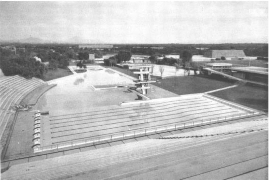
Swimming and diving pools at the University of Mexico for the II. Pan American Games (March 1955). With its handsomely landscaped surroundings, this is undoubtedly one of the most beautiful swimming installations to be seen. Dressing-rooms are under the stands in the foreground.