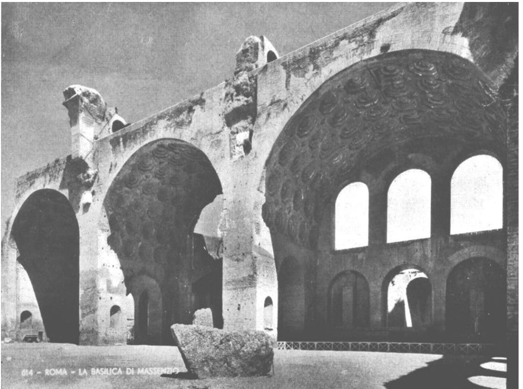
Rome 1960. — Vue de la basilique de Massenzio où les organisateur? des Jeux de la XVII e Olympiade se proposent d'organiser les compétitions de lutte gréco-romaine. A droite de cette Basilique se trouve le Colisée et derrière, le « Foro Romano ». On ne saurait trouver un cadre plus approprié.