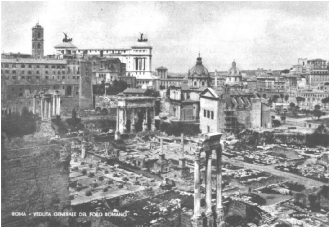
Jeux de la XVII e Olympiade, Rome 1960. — Vue du « Foro Romano » que le porteur de la flamme olympique traversera pour se rendre au Capitole (avec sa tour à gauche sur notre cliché) avant de terminer au stade olympique à l'ouverture des Jeux.