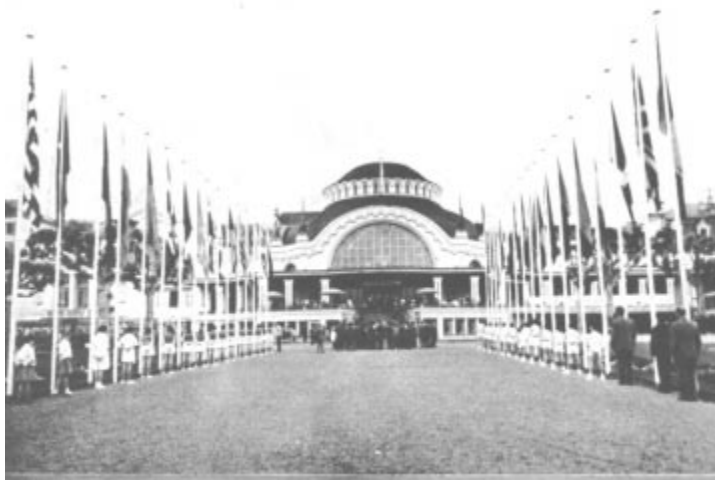
Après le lever des drapeaux devant le Casino d'Evian, la Fanfare municipale exécute l'Hymne Olympique.