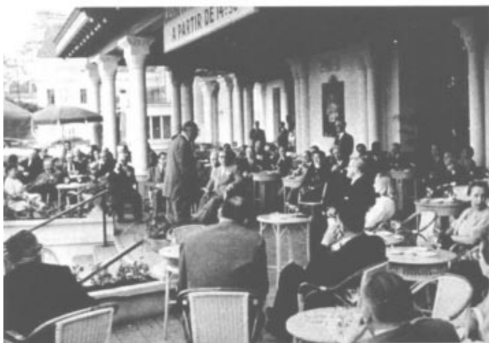
Réception sur la terrasse du Casino d'Evian : M. Armand Massard, président du Comité Olympique Français prononce une allocution.