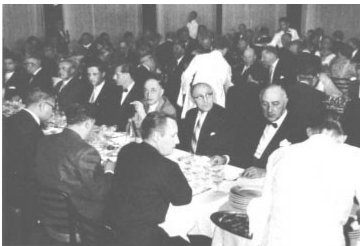
Au dîner offert par la Société des eaux minérales d'Évian au Casino.

entre la Commission Exécutive du Comité International Olympique, les représentants des Fédérations Internatio- nales et des Comités Nationaux Olympiques.