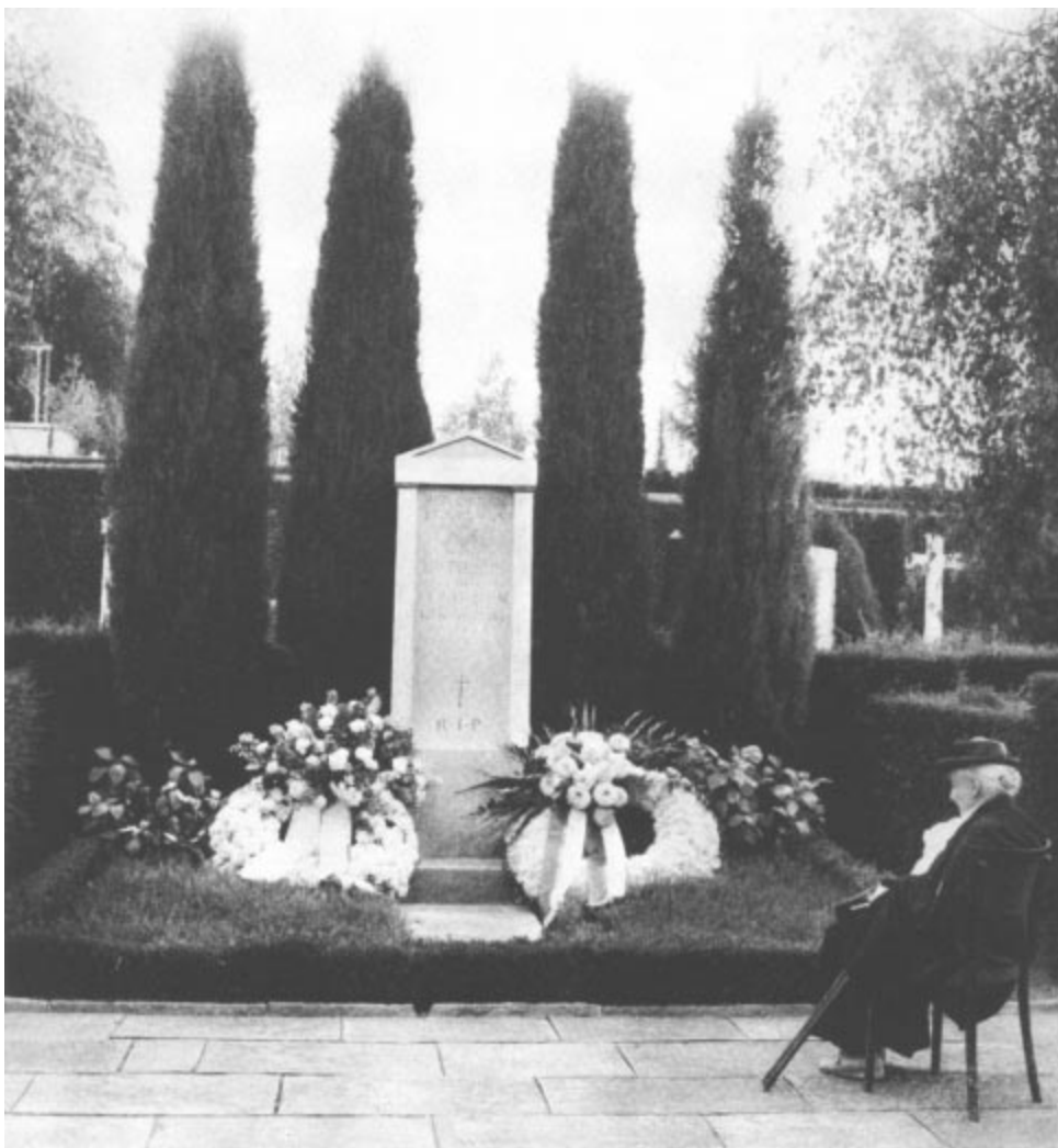
La Baronne Pierre de Coubertin se recueille devant la tombe de son mari, le jour de la commémoration du 20 e anniversaire de sa mort. 2 septembre 1957.

(Voir texte dans la partie rédactionnelle du présent bulletin.)