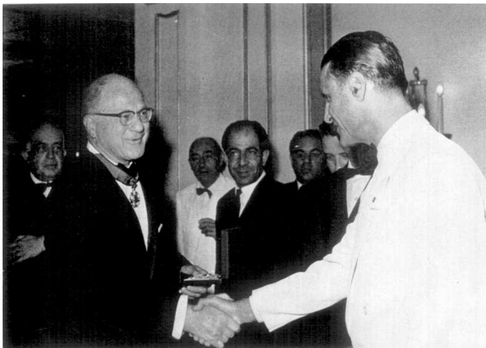
Le président Brundage vient de recevoir des mains de S. E. M. le Ministre Pierre Gemayel la distinction de Commandeur de l'Ordre du Cèdre. Beyrouth, octobre 1959.