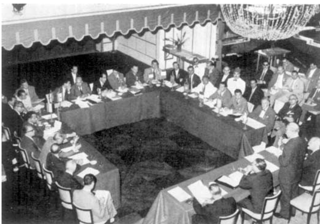
Le Congrès des Jeux Méditerranéens. Onze Comités Olympiques représentés. M. Brundage prononce un discours. Beyrouth, octobre 1959.