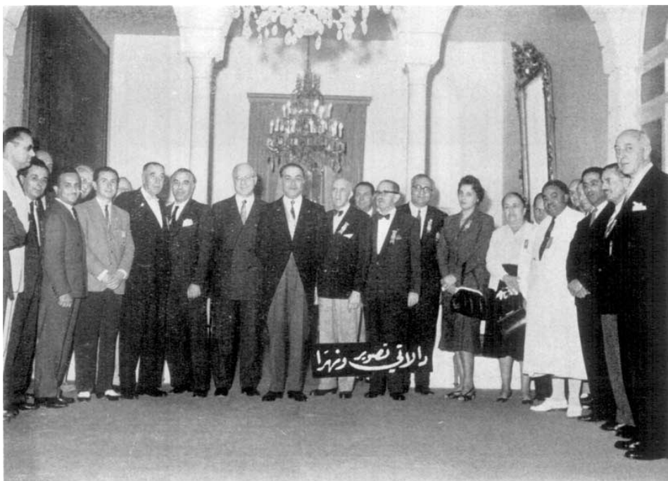
S. E. L'Emir Chéhab, président de la République libanaise reçoit en sa résidence près de Beyrouth, les membres du Comité International Olympique et les délégués des Comités Olympiques des pays méditerranéens. Octobre 1959.