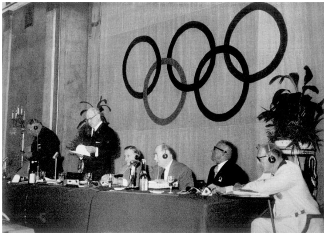
La Commission Exécutive pendant le Session de Rome.