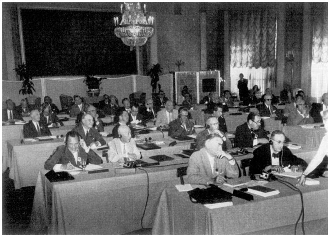
ROME 1960. Pendant la Session.