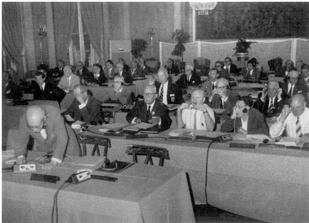
ROME 1960. Pendant la Session.