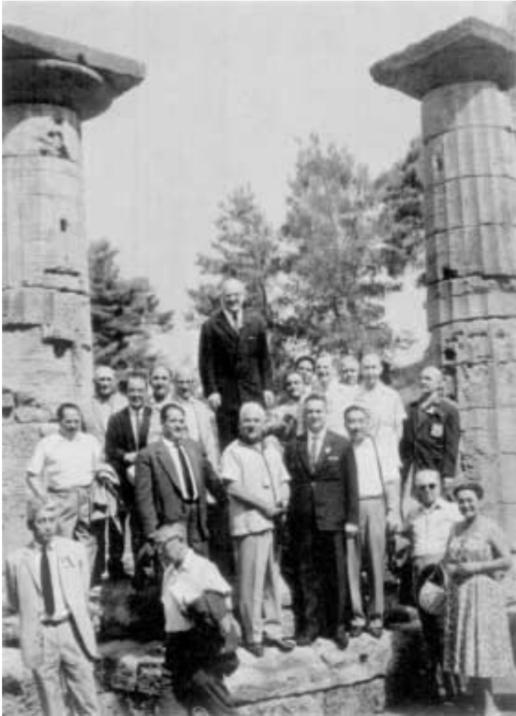
A Olympie 1961. M. Avery Brundage, tel le Zeus de l'Olympie moderne, entouré de délégués olympiques.