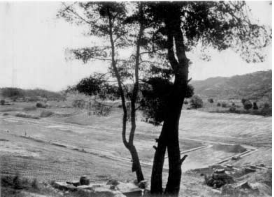
Olympie, avril 1961. Vues des travaux de l'excavation du stade ancien d'Olympie avant d'être terminés. On sait que ces travaux sont exécutés sous la direction du Prof. Dr Emil Kunze aux frais et par les soins de l'Institut archéologique allemand d'Athènes qui a bien voulu nous fournir ces photos qui sont de E. M. Czako.