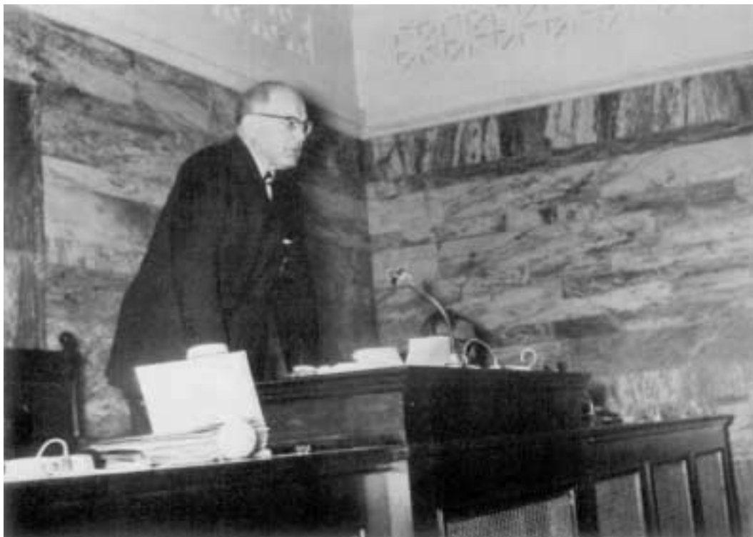
M. Avery Brundage préside la 58 e Session d'Athènes 1961.