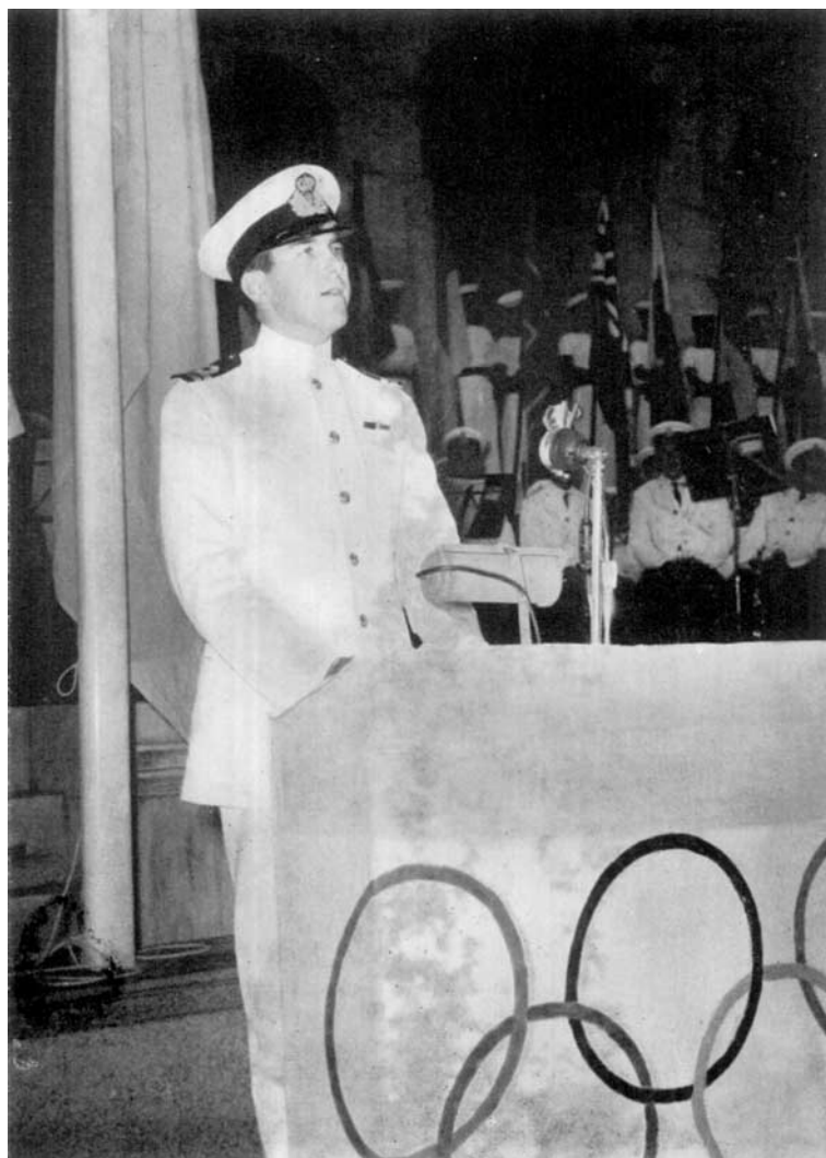
S. A. R. Le Prince Constantin, Duc de Sparte, prononce son discours à la séance solennelle d'ouverture de la 58 e Session à Athènes 1961.