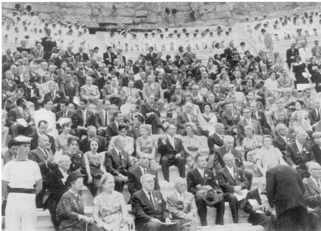
A la cérémonie solennelle d'ouverture de la 58 e Session.