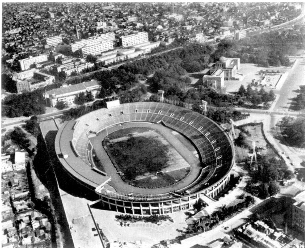
Tokyo. - Le stade principal.