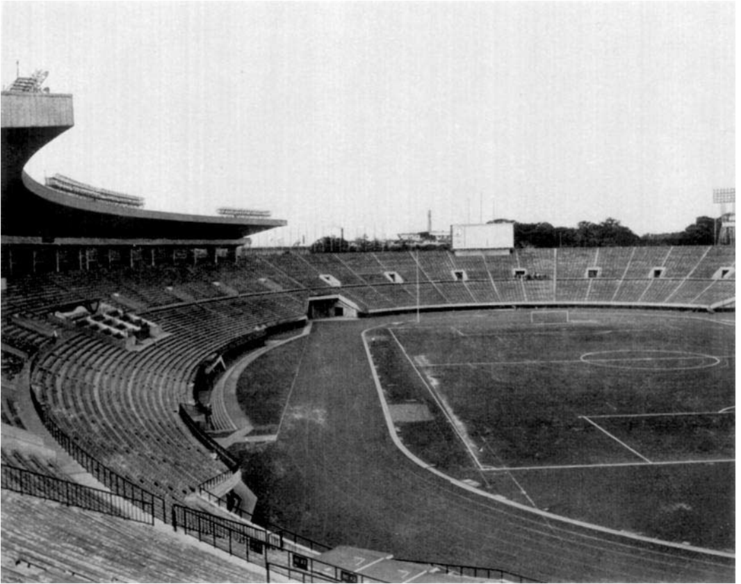
Tokyo. - Les pistes du stade. Sous les stands: une piscine de 25 mètres, un hôtel pour sportifs, un musée des sports, etc.