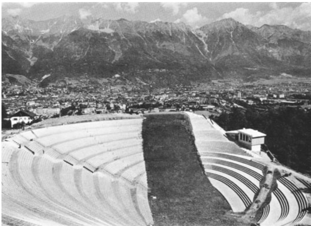
Innsbruck 1964. Le tremplin de saut et les gradins pour les spectateurs. Au second plan, la ville d'Innsbruck

Ci-dessous: Innsbruck 1964. Les bâtiments du village olympique. Après les Jeux ce complexe servira de logements pour la population.