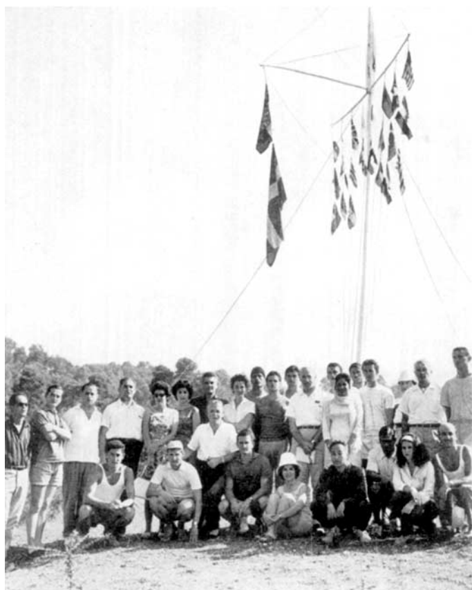
Un groupe de participants.