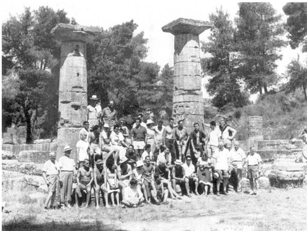
Les participants des 23 nations.