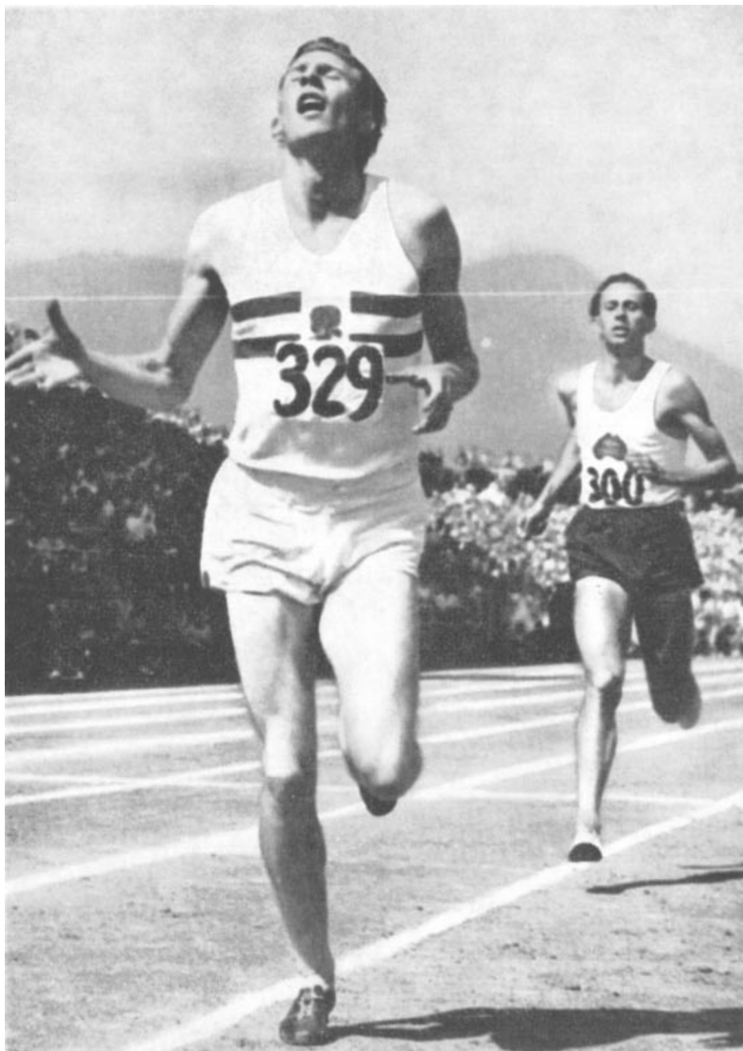
Vainqueur ou vaincu, mais jamais le même homme.