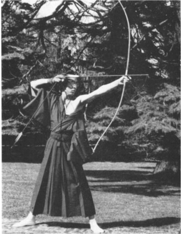
Tokyo 1964 - démonstration