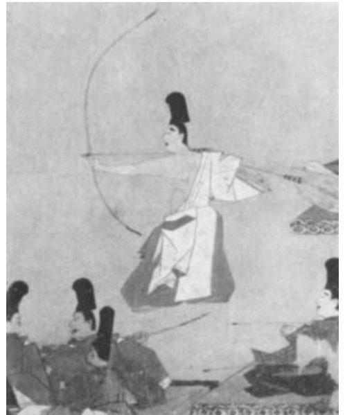
Chasseurs africains. (Gravure ancienne.)