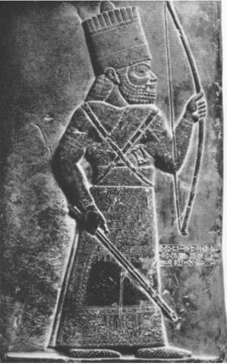
Stèle-document de la période assyro-kassite. (Fin du XIIIe au Xe siècle av. J.-C.)