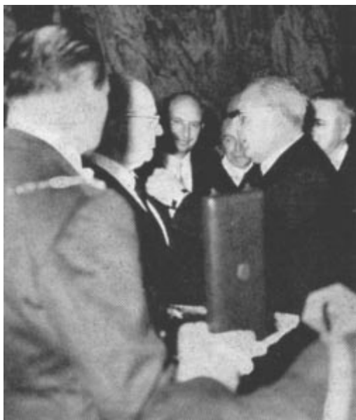
Avery Brundage, décoré par le président Saragat : « Nous devons être à la hauteur des responsabilités dont nous sommes investis. »

des affaires, sur le fameux caveat emptor , au fur et à mesure que le spectateur se laisse instruire par l'athlète.