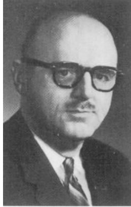
Maître Jean DRAPEAU Maire de MONTREAL