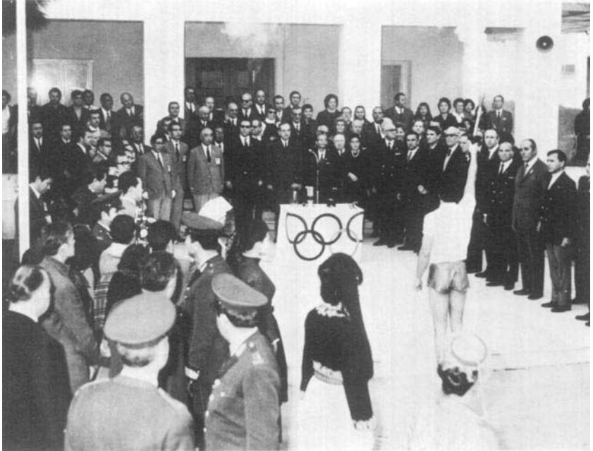
La flamme, portée par M. Christos PAPANICOLAOU, recordman du monde du saut à la perche, arrive à l'aéroport d'Athènes.