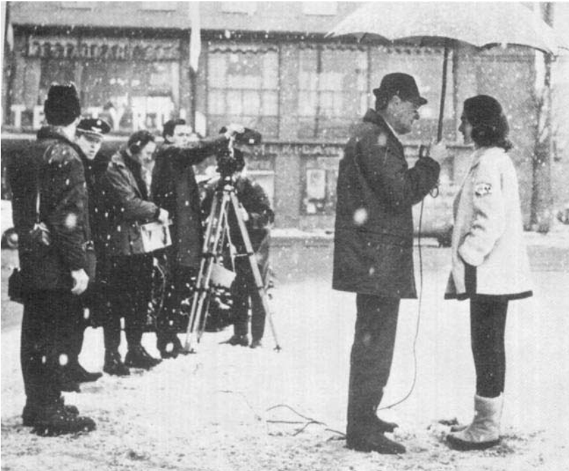
Interview sous la neige (Innsbruck 1964).

sente pas que des avantages pour les organismes contractants. Pour obtenir un programme sportif, surtout s'il doit être transmis en direct et en totalité, les organismes versent des sommes non négligeables aux organisateurs. Les frais encourus pour la production de l'image sont également considérables. Les organismes de télévision visés par le contrat peuvent-ils alors risquer de ne pas être détenteurs d'une exclusivité leur assurant le monopole de transmission en télévision? La diffusion du programme sportif ne doit pas être déflorée par des diffusions concurrentielles par d'autres stations, par des systèmes de télévision en circuit fermé, par des réceptions publiques incontrôlées. Comment le promoteur peut-il leur garantir l'exclusivité requise? Les termes du modèle de contrat vi-