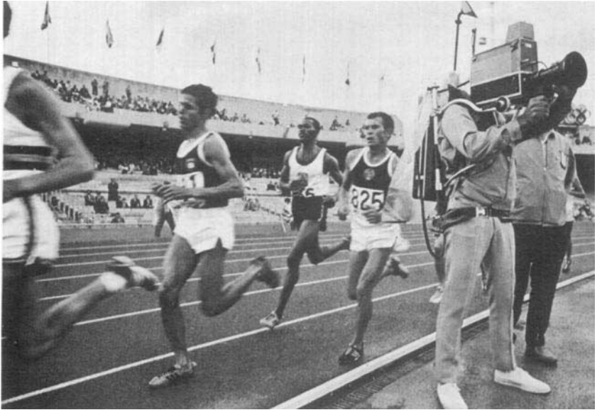
La télévision aux Jeux Olympiques de Mexico - 1968.

vraient comme les artistes jouir d'un droit leur permettant de mettre obstacle à l'exploitation en télévision des activités qu'ils déploient dans la compétition sportive, n'a pas été prise en considération par le législateur international lors de l'élaboration de la Convention de Rome, en 1961. La définition des artistes, telle qu'elle figure dans l'article 3a), limite l'application de la Convention aux artistes, interprètes ou exécutants, c'est-à-dire selon les termes employés aux "acteurs, chanteurs, musiciens, danseurs et autres personnes qui représentent, chantent, récitent, déclament,