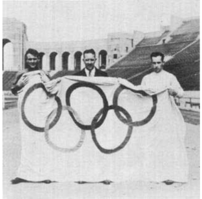
Bill HENRY (au centre) dans le stade Olympique de Los Angeles en 1932.

Nous sommes persuadés que son geste rencontrera l'appui de tous ceux qui veulent contribuer à la promotion du sport dans le monde.