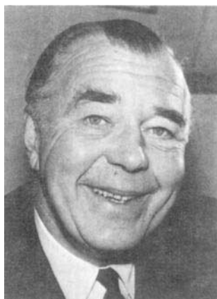
Le prince Bertil, président du Comité olympique suédois.