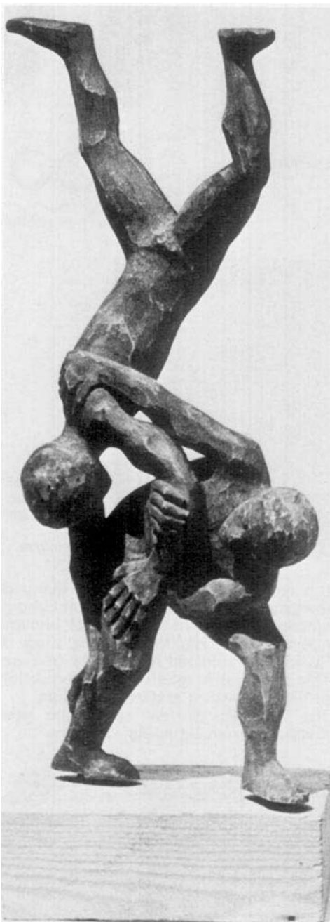
Sculpture en bois de Waldemar Nonsakonski.