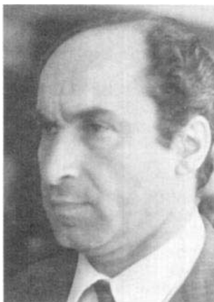
M. Mohamed Mzali, président du Comité olympique tunisien.

Le IV e Congrès international pour la documentation des sciences relatives aux sports se déroulera du 7 au 11 mai 1973, à l'École fédérale de gymnastique et de sport de Macolin (Suisse).