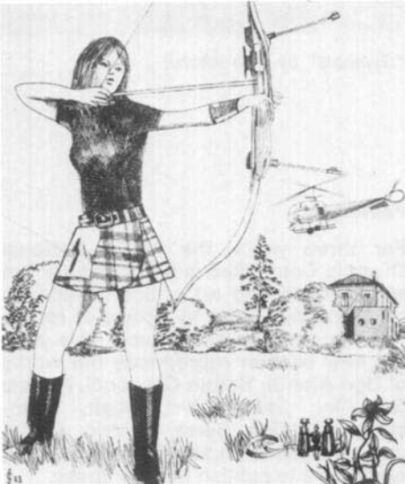
« La jeune fille et son arc », par Sergio Ceccocci.