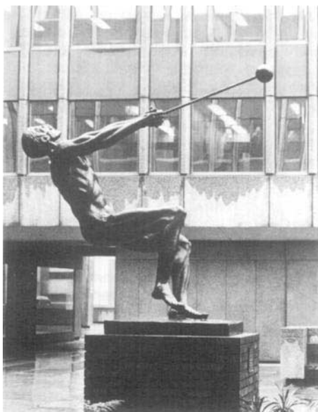
« Le lanceur de marteau », par John Robinson.

Traversant Tower Place, les Londoniens peuvent depuis quelques mois admirer « Le lanceur de marteau », sculpture exécutée par l'artiste John Robinson en fibre de verre bronze. Cette œuvre fut offerte à la cité de Londres et inaugurée le 7 décembre dernier. Nous remercions M. John Hennessy, chroniqueur sportif du Times, de nous avoir procuré la reproduction de cette statue (voir notre photographie).