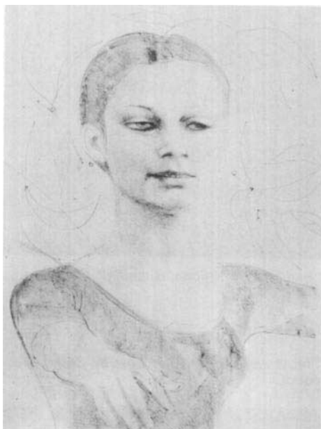
« Gymnaste », par Ugo Attardi.