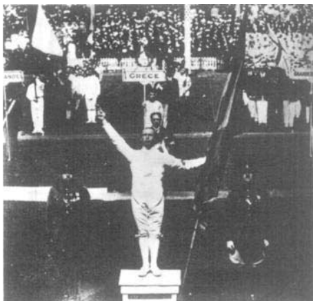
1920 - Anvers