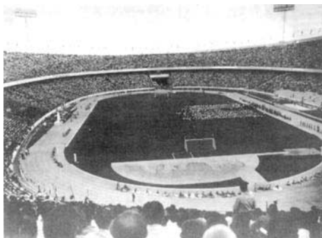
Le stade Aryamehr.

● Quatre nouveaux pays font partie de la Fédération des Jeux Asiatiques depuis février dernier — l'Iraq et la République Démocratique Populaire de Corée, ainsi que la République Populaire de Mongolie et l'Arabie Séoudite, ces derniers à la condition de compléter leur demande d'adhésion.