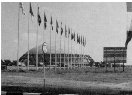
Le Palais des Sports de Tunis.

Cité Nationale Sportive de Tunis avec un palais des sports (6500 places), un stade de 45 000 places, un stade nautique de 5000 places (bassin olympique, fosse de plongeurs, 3 bassins couverts).