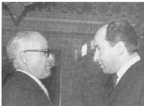
Le Président de la République Tunisienne, M. Habib Bourguiba, s'entretient avec M. Mohamed Mzali (à droite).