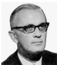
Dr Alejandro Giammattei Caceres, président

Grand sportif, il a pratiqué de nombreux sports (basketball, volleyball, tennis de table...) et est encore maintenant joueur actif de softball.