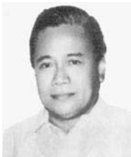
Col. Arsenio de Borja, secrétaire général

● Depuis 1970, le colonel Arsenio de Borja occupe le poste de secrétaire général du « Philippine Olympic Committee ». Militaire de carrière, il fut successivement officier des sports et des loisirs des forces armées des Philippines, de 1946 à 1948, puis chef des services sportifs et des loisirs de l'armée de l'air de 1948 à 1950. En 1957, il devint directeur des services spéciaux de l'armée de l'air, poste qu'il occupa jusqu'en 1963. Il fut en outre président de l'Association amateur de natation des Philippines, de 1961 à 1972. Depuis 1970, il assure également les fonctions de secrétaire-trésorier de la Fédération d'athlétisme amateur des Philippines.