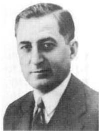
Selim Sirri Tarcan

des épreuves officielles organisées à Saint-Louis, lors de la célébration de la IIIe Olympiade. Enfin, une délégation turque participa, en 1906, aux premiers et uniques « Jeux intermédiaires » d'Athènes. Cependant, il fallut attendre 1907 pour apercevoir les prémices d'un mouvement olympique national. De passage à Istanbul, Pierre de Coubertin visita l'un de ses amis de jeunesse, M. Gouvery, alors professeur de littérature française au lycée Galatasaray. Celui-ci lui conseilla de prendre contact avec Selim Sirri Tarcan*, fervent adepte du sport. L'entrevue eut lieu à l'hôtel Tokatliyan et Tarcan, dans son ouvrage Jeux Olympiques anciens et modernes , édité en 1911, rapporte en ces termes ce premier entretien : « Il me proposa de devenir membre du CIO et d'organiser le Comité National Olympique. Sa proposition me toucha, mais il me fallut lui dévoiler les conditions dans lesquelles nous vivions. Il était alors impossible à plus de deux personnes de s'asseoir pour converser ensemble. Coubertin vaincu ajouta cependant : « Soyez mon représentant et gardons confiance. »