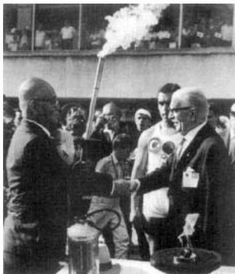
1964 - A l'occasion du passage de la flamme olympique en Turquie, Buhan Felek (à droite) reçoit le président du CNO du Japon, M. Takasima (à gauche).