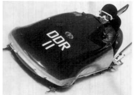
Meinhard Nehmer Bernhard Germeshausen (GDR)