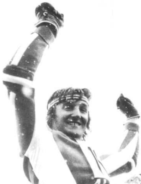
Piero Gros (ITA)