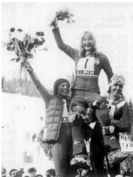
Rosi Mittermaier (RFA), Kathy Kreiner (CAN), Danièle Debernard (FRA)