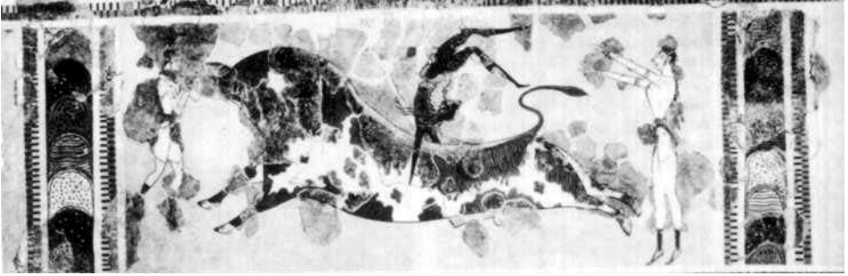
La femme crétoise pratique la danse. Mais elle court aussi; elle conduit des chars rapides tirés par des chevaux, et même elle pratique les deux sports majeurs des hommes: le pugilat et la tauromachie. Le saut du taureau. Fresque du palais de Knosos. XVI e siècle av. J.-C. Musée de Héraklion.

me de chacune des seize villes de l'Elide afin de régler le différend, cette femme devant être la plus âgée, la plus noble et la plus estimée de toutes les femmes. Les femmes de ces villes firent donc la paix entre Pise et Elée. Plus tard, on leur confia la direction des Jeux Héréens et le soin de tisser le « péplos » pour Héra. » 17 De même que les Hellanodices, le célèbre collège féminin ne pouvait entrer dans ses fonctions directrices sans s'être convenablement purifié par le sacrifice d'un porc ainsi que par les ablutions rituelles à la fontaine Piera. 18