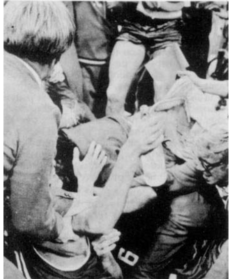
« Violence sur les stades. »

Ce traitement bienveillant des cas mentionnés s'explique facilement étant donné les circonstances spéciales dans lesquelles naissent les faits incriminés. La tendance en faveur de la solution dont nous rendons compte a eu une consécration très limitée dans les textes positifs: en effet, elle a été acceptée, dans les articles 438 et 449 du Code pénal équatorien et dans l'article 449 du Code de défense social cubain 25