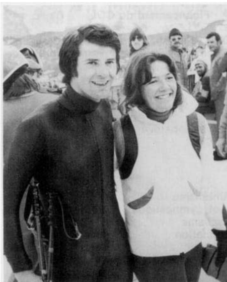
Willy Frommelt et Hanny Wenzel.