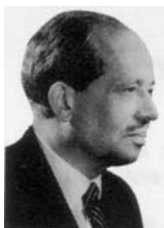
Prince François-Joseph II de Liechtenstein