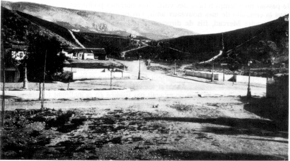
Athènes: Le stade olympique en 1894.

quitter Athènes, les conclusions décourageantes auxquelles s'étaient arrêtés ses collègues et lui-même. En somme, il m'invitait courtoisement à ne pas venir et à renoncer à mon dessein olympique.