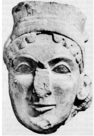
Tête monumentale d'Héra, déesse autochtone d'Olympie. En son honneur avaient lieu les Jeux Héréens. Vers 600 av. J.-C. Olympie, Musée Archéologique.