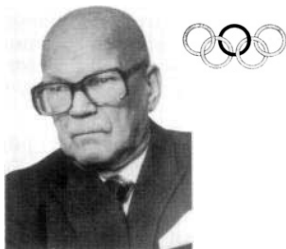
Le Président Urho Kekkonen