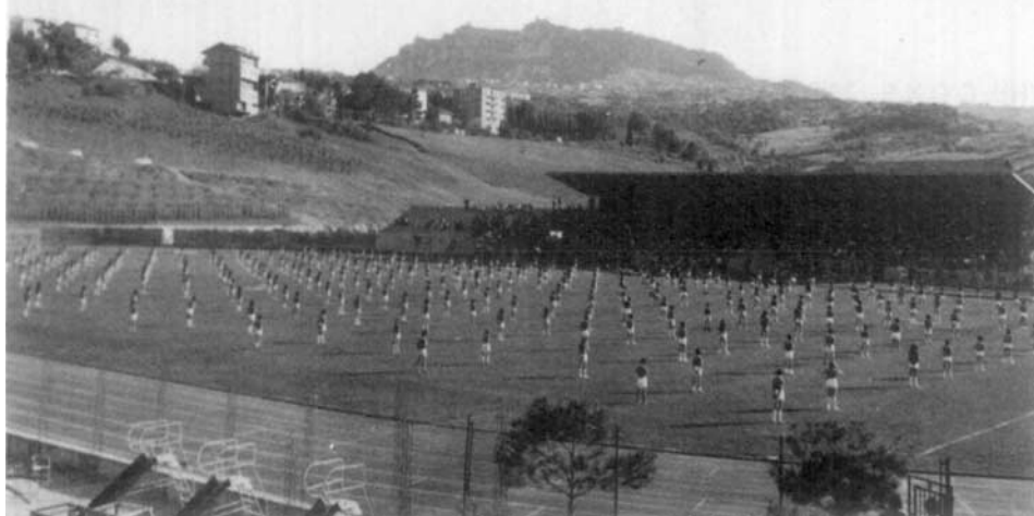
Dans le Centre national des sports, le stade de Serravalle, le plus important de Saint-Marin.