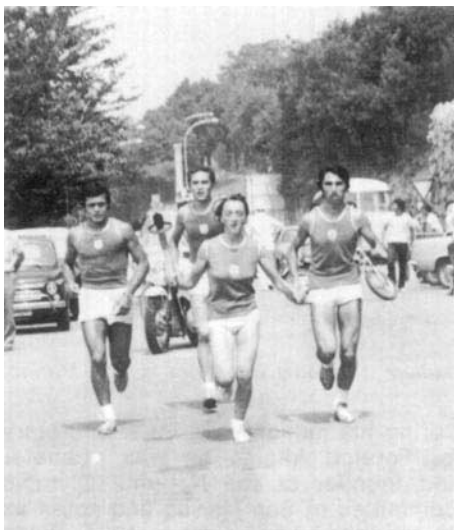
Juillet 1972: La journée olympique.