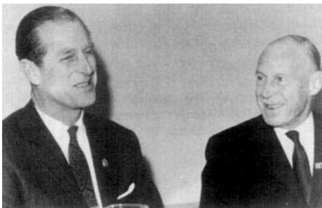
SAR le Prince Philip et le chevalier Henri de Menten de Horne.

b) Pour l'année 1977, ces produits seront considérés comme produits interdits pour tous les chevaux prenant part à des épreuves internationales de dressage et à des championnats de dressage. Ils ne sont pas considérés comme produits interdits pour les chevaux participant à des épreuves dans d'autres disciplines.