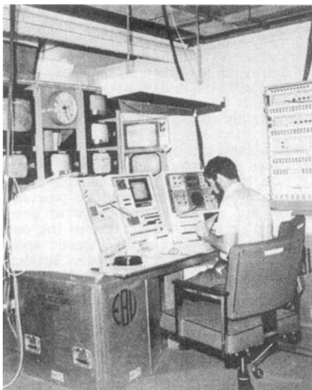
La régie finale mobile de l'UER fut utilisée pour la première fois à Montréal.

Ainsi je tiens à insister sur quatre points. Premièrement, l'information interne entre les divers points de liaison de chaque organisme membre laisse beaucoup à désirer. Deuxièmement, il convient de respecter beaucoup mieux les délais que ce n'a été le cas cette fois, même si nous devons naturellement faire preuve d'assez de souplesse pour ménager la possibilité de décisions