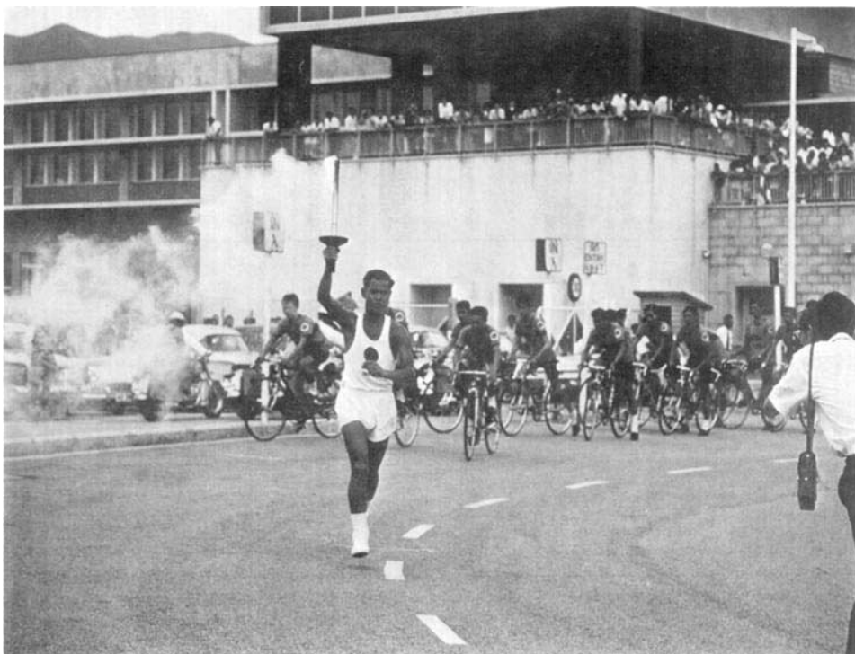
1964 - La flamme olympique à Hong Kong.