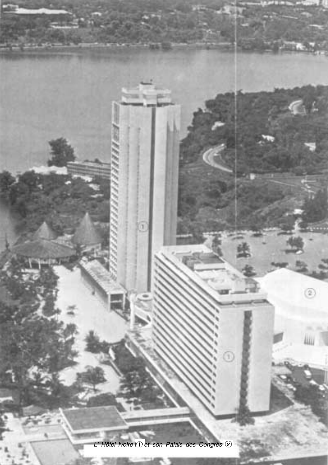
L' Hôtel Ivoire ① et son Palais des Congrès ②