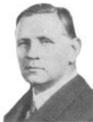
J. Sigfrid Edström