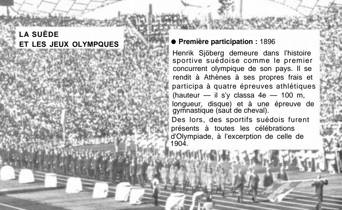
1972 - Munich : la délégation suédoise.

Des lors, des sportifs suédois furent présents à toutes les célébrations d'Olympiade, à l'exception de celle de 1904.