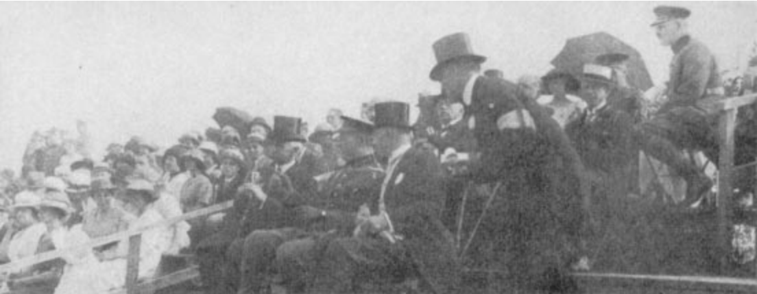
Pierre de Coubertin et Henri de Baillet-Latour aux côtés de SM le Roi Albert.

MEMOIRES OLYMPIQUES, par Pierre de Coubertin ©