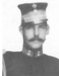
Prince héritier Constantin (1896)