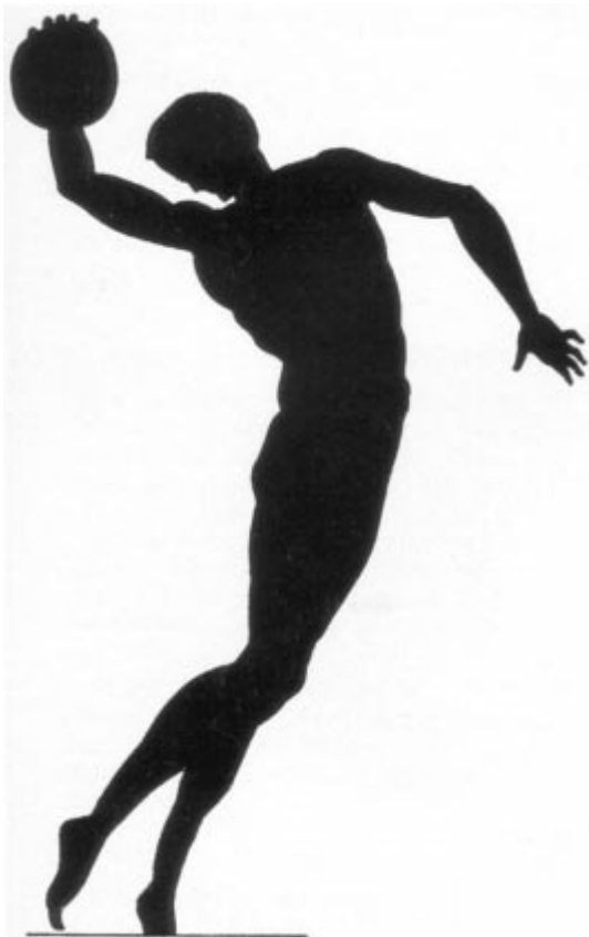
Athlète antique lançant le disque d'après un vase panathénaïque.