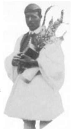
1896 - Spiridon Louys