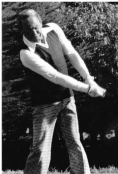
Le roi du Maroc.

Elles étendent leur influence dans les endroits les plus éloignés et sont gérées par des animateurs bénévoles qui n'ont d'autre but que de permettre à la jeunesse de ce pays de s'adonner aux jeux de plein air et de la soustraire aux méfaits d'une vie quelque peu relâchée et trop souvent nuisible à sa santé physique et morale dans laquelle se complaisent trop souvent les jeunes d'aujourd'hui.