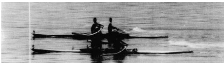
Lac Karapiro (NZL) - championnats du monde 1978. L'arrivée « au couteau » pour la troisième place de la finale du deux sans barreur entre l'équipage français No 3, déclaré troisième par la « photo-finish » ci-dessus, et l'équipage hollandais No 4.

En 1983 les régates du cinquantenaire du Rotsee auront lieu les 9 et 10 juillet.