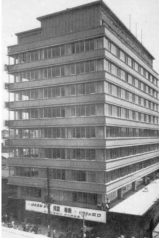
Le « temple » du sport amateur coréen.

Sous les auspices du ministère de l'Education, qui régit les programmes