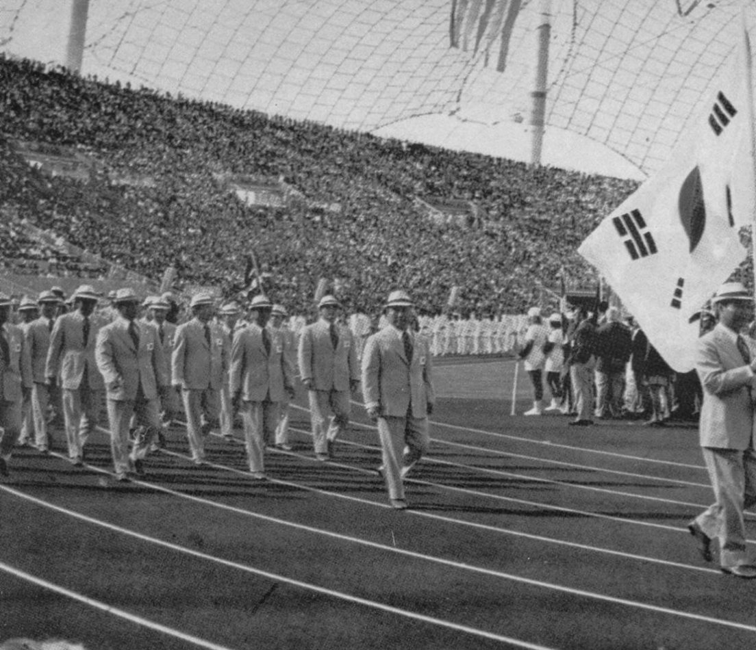
Munich 1972 - La délégation coréenne.