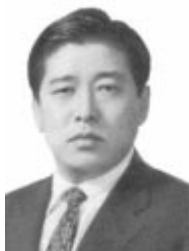
Général Un-Yong Kim