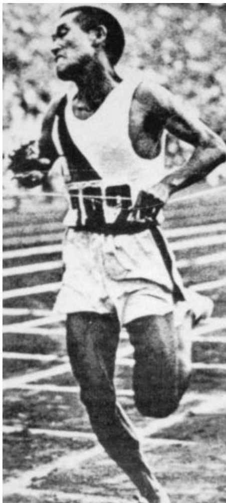
1936 - Kee Chung Sohn

Le marathonien Seung-Yong Nam, compatriote de Kee Chung Sohn et membre de la même équipe aux Jeux à Berlin, obtint la médaille de bronze.