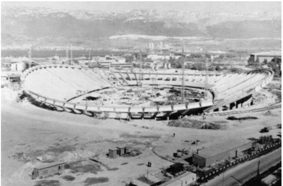
Split : le stade principal.

● A Sinj, où aura lieu l'équitation et un tour préliminaire de handball, se trouve un bas-relief de pierre, daté du premier siècle et représentant un homme, en tenue sportive, tenant dans la main droite un ballon formé de plusieurs hexagones, très semblable à celui utilisé par les footballeurs d'aujourd'hui.