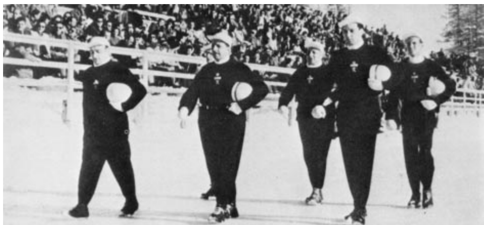
1948 - Saint-Moritz : l'équipe belge de bobsleigh.