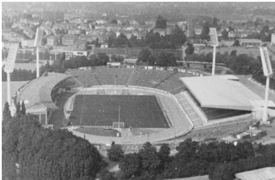
Le stade du Heysel.

ceci au taux maximum de 60 pour cent d'intervention,