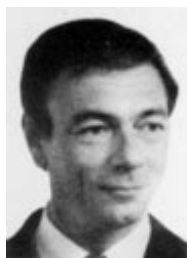
Prince Alexandre de Mérode, membre du CIO