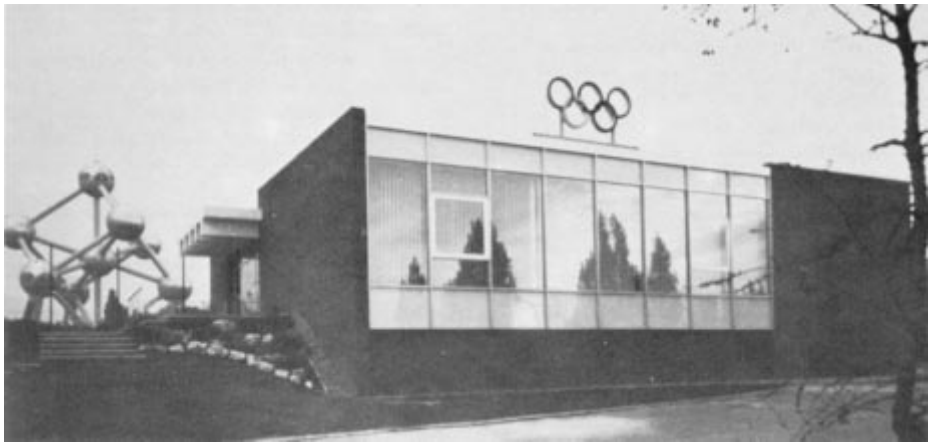
La « Maison olympique », siège du COIB, fut inaugurée en 1973 et se trouve à 200 m du stade du Heysel et de l'Atomium.