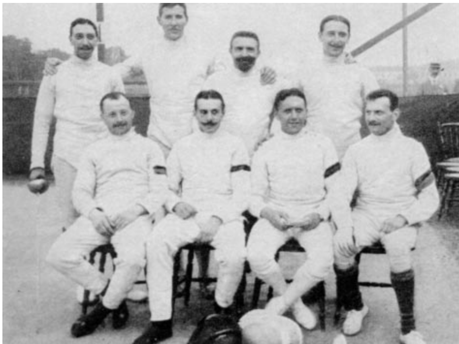
1912 - Les escrimeurs belges avec l'exceptionnel Paul Anspach, futur président de la Fédération Internationale d'Escrime, son frère Henri, Fernand de Montigny.