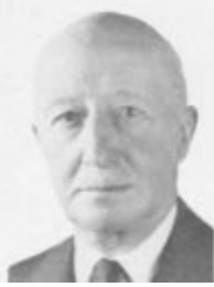
Général baron de Trannoy