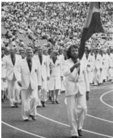
1976 - Montréal: Gaston Roelants, champion olympique du 3000 m steeple, portedrapeau de la délégation belge.

Bruxelles : ville candidate à l'organisation des Jeux Olympiques de 1960 et de 1964.