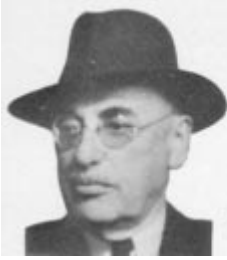
Rodolphe William Seeldrayers