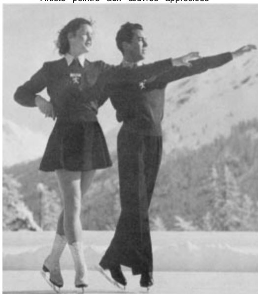
1948 - Micheline Lannoy - Pierre Baugniet