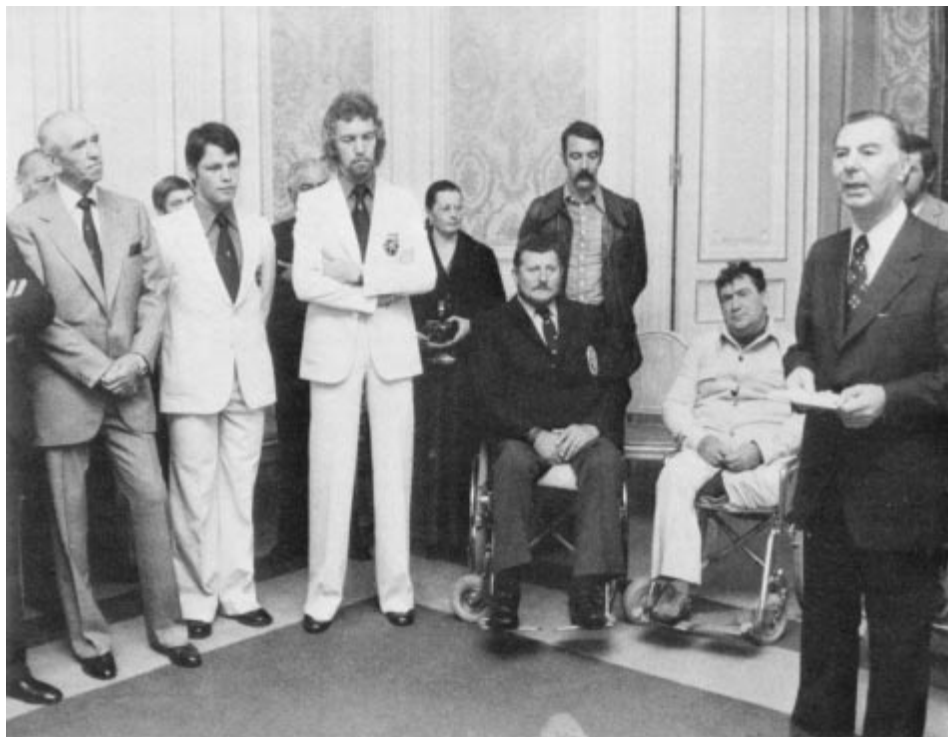
L'intérêt de l'Etat belge se trouve aussi bien au niveau du sport pour tous, que du sport pour handicapés, sport olympique... M. Tindemans, premier ministre à l'époque, rend hommage sur notre document aux lauréats sportifs 1976. A gauche figure le président du COIB.

En 1971 intervenait une loi définissant les matières culturelles, et parmi celles-ci, « l'éducation physique, les sports et la vie en plein air », éducation physique devant s'entendre à l'exclusion de celle pratiquée dans le cadre des programmes scolaires.