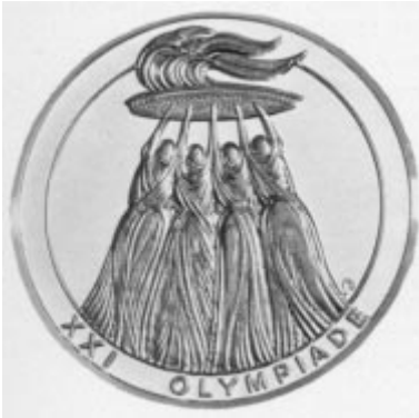
Médaille du COB

ou destinés à aider au développement du sport. Citons :