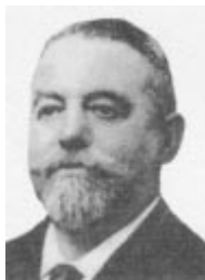
Baron Edouard-Emile de Laveleye

Il est mort le 31 mars 1974 alors qu'il venait d'atteindre ses 88 ans.