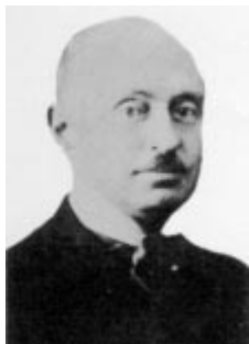
Henri de Baillet-Latour, Président du CIO

ses à pied. De plus, la Ligue pédestre belge n'ayant pu envoyer des représentants, elle avait fait parvenir son adhésion par écrit.