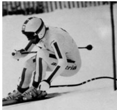
Annemarie Moser-Proell (AUT).