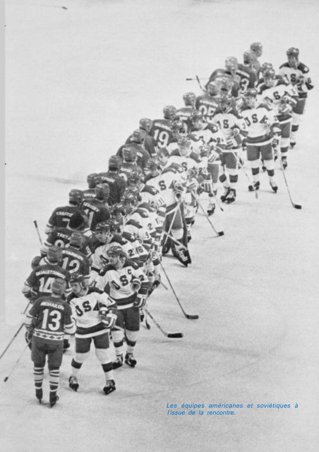
Les équipes américaines et soviétiques à l'issue de la rencontre.