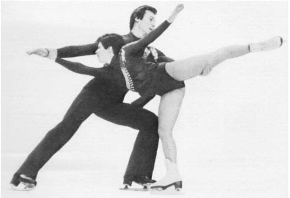
Irina Rodnina - Alexander Zaitsev (URS).