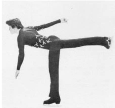
Robin Cousins (GBR).